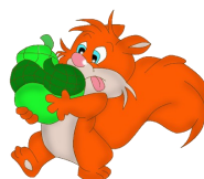
ou un écureuil ?