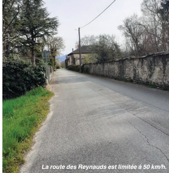
La route des Reynauds est limitée à 50 km/h.

La prévention routière concerne tout le monde ; elle en appelle au civisme de chacun.