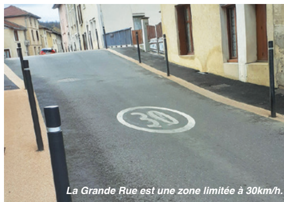
La Grande Rue est une zone limitée à 30km/h.