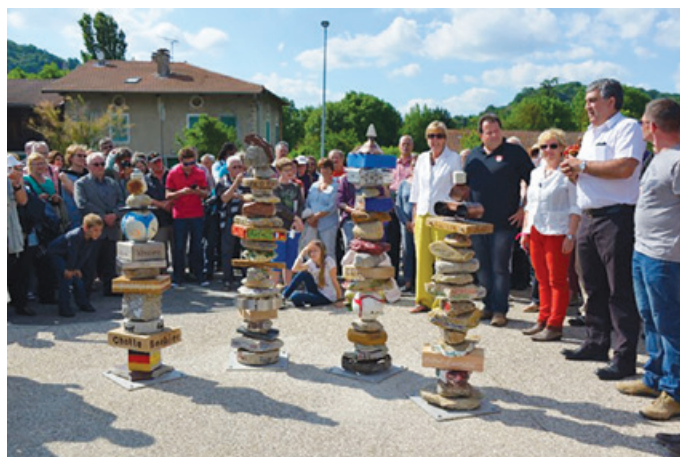
La célébration des 10 ans du jumelage avait déjà été l'occasion d'un week-end de fête à Chatte.