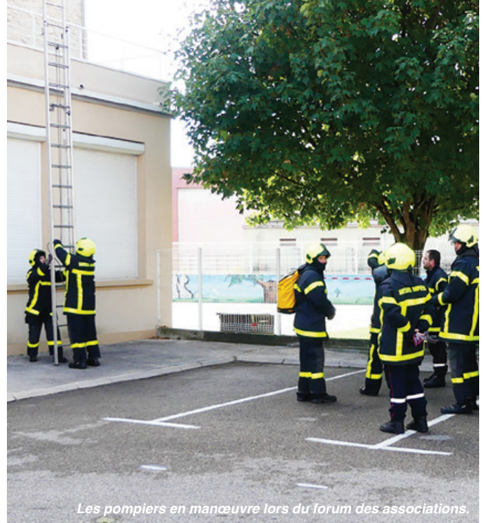
Les pompiers en manœuvre lors du forum des associations.